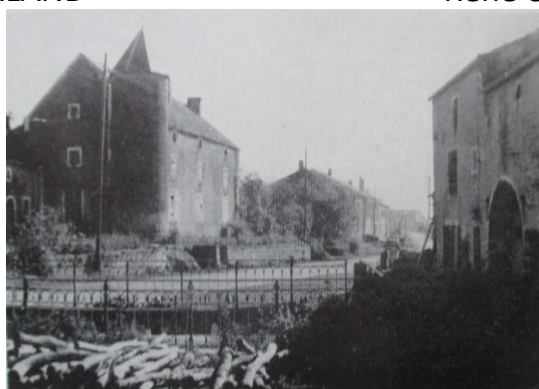
Le Pâquis – Varennes